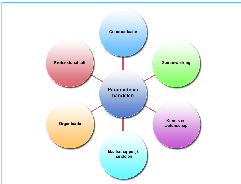
Figuur 2. Paramedische Competenties

In 2011 hebben de binnen het Kwaliteitsregister Paramedici participerende beroepsverenigingen besloten om de overstijgende paramedische competenties te beschrijven volgens de universele methode van de Canadian Medical Education Directions for Specialists (CanMEDS). De CanMEDs competentiegebieden zijn onlosmakelijk met elkaar verbonden; de kern van de beroepsuitoefening is voor de paramedicus het paramedisch handelen. Alle andere competentiegebieden krijgen er richting door (figuur 2). Het model wordt gehanteerd binnen bij- en nascholingen en ziet toe op verdieping en verbreding van de hedendaagse zorgverleners. Door binnen de kwaliteitscriteria competenties te gebruiken kan het beroepsinhoudelijk handelen inzichtelijk worden gemaakt en getoetst. Via www.kwaliteitsregisterparamedici.nl is een toelichting op de competenties terug te vinden.