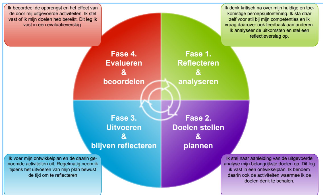
Figuur 1. Cyclus Individuele Professionele Ontwikkeling (IPO)

Professionele ontwikkeling door het voortdurend verbeteren van kennis en vaardigheden, is essentieel voor het behouden van een hoog niveau van vakbekwaamheid. Het cyclische proces valt onder te verdelen in vier fasen: 1) Reflecteren en analyseren, 2) Doelen stellen en plannen, 3) Uitvoeren en blijven reflecteren en 4) Evalueren en beoordelen. In de kwaliteitscriteria wordt dit proces Individuele Professionele Ontwikkeling (IPO) genoemd (figuur 1).